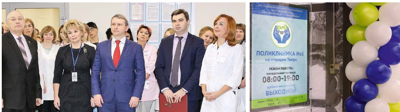
Открытие поликлиники отметили своим присутствием высокие гости